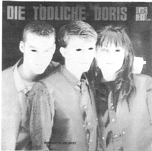
LP „Unser Debut“ 1985 published by ATATAK, Märkische Straße 16, 4000 Düsseldorf 12, France. Best.Nr. 820033 Verlag „plane“ GmbH, Postfach 827, 4600 Dortmund 1