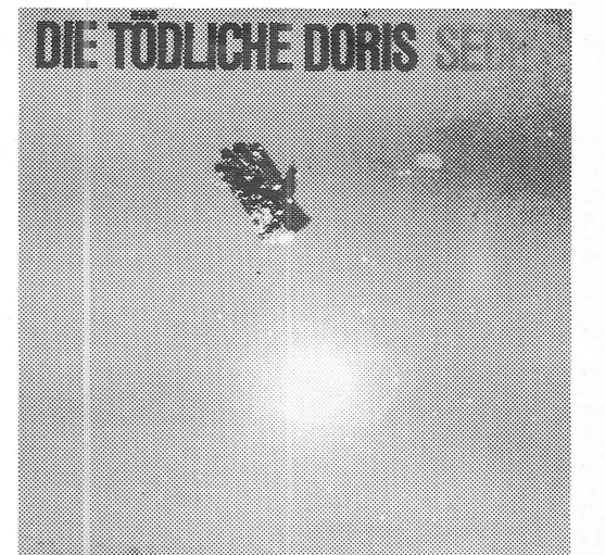
LP „sechs“ 1986 published by ATATAK, Märkische Straße 16, 4000 Düsseldorf 12, France. Best.Nr. 820035 Verlag „plane“ GmbH, Postfach 827, 4600 Dortmund

Jetzt ist die Zeit gekommen, in der Du Deine Krücken wegwerfen kannst. Bis zum heutigen Tag glaubtest Du, Du müßtest immer wieder neue Schallplatten kaufen. Doch die Platte, die Dich aus diesem Zwang erlöst, wird nie bei irgendeiner Schallplattenfirma erscheinen. Diese bleiben immer verstrickt in das Netz der kommerziellen Verwertungsstrukturen. Die Hohepriester des Materiellen – Todfeinde des reinen Geistes. Abertausende von Schallplatten sind erschienen, bevor Du geboren wurdest und werden weiter erscheinen, wenn Du längst gestorben bist. Diese Platte erscheint nur durch Dich!